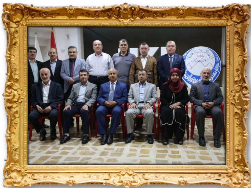
دەستەى كارگىڭىو بەرپۆەبەرى لڧەكانى رابىتەى ئىسلامىى كورد