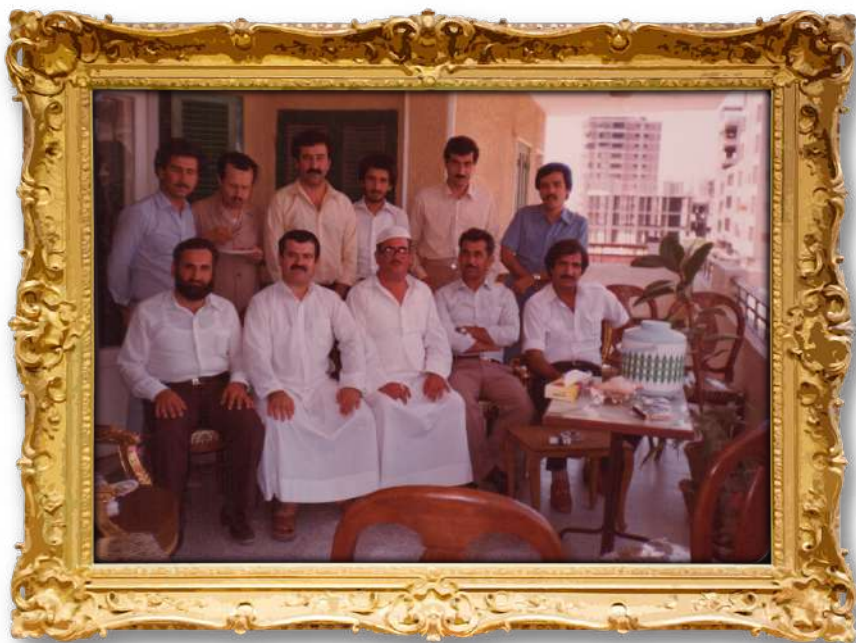
دكتور لەگەن ھەندىك لەبرايان