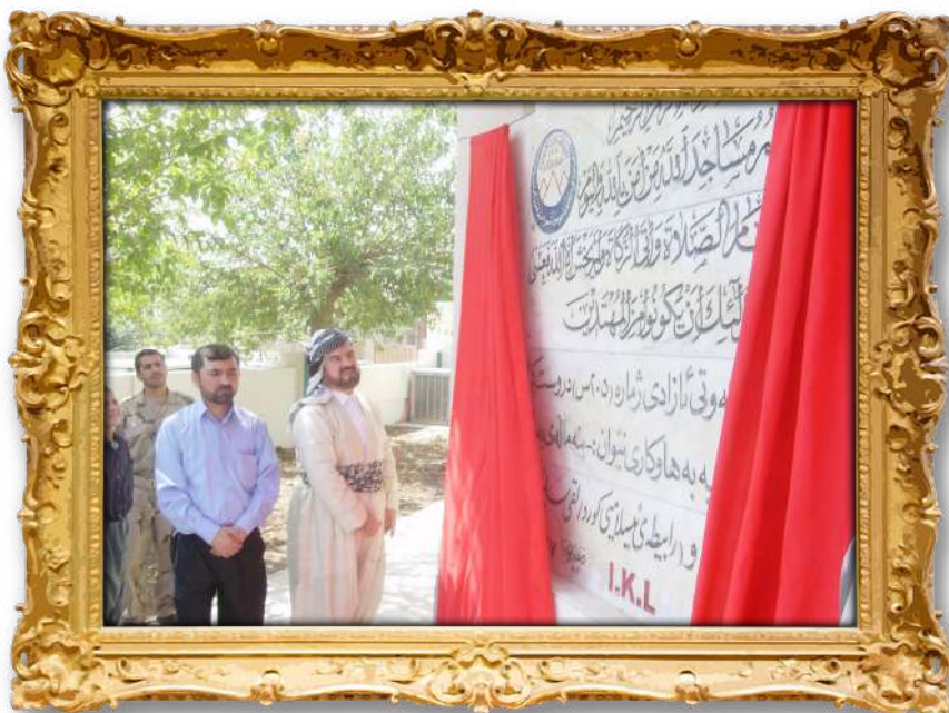
دکتور عہلی قہرہداغی لہکاتی کردنہوہی پروژہیہ کی رابیتهی ئیسلامیمی کورددا