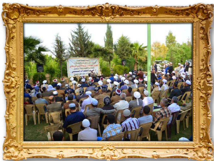
كۆبۈنەھەۋى دكتور لەگەن زانايانى ئاپنىيدا