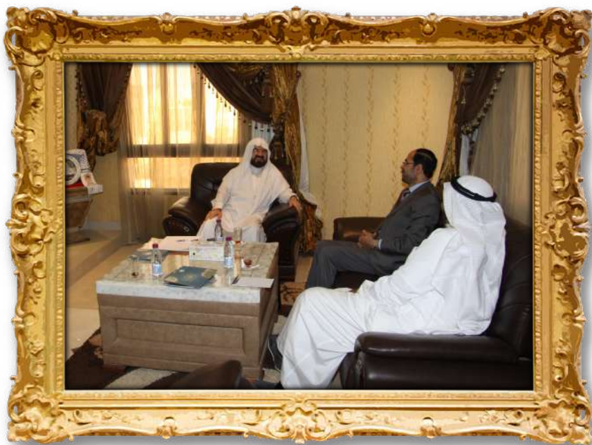
دكتور عەلى لەدەيدارى رېكخراوى كىبىرى ئەمريكى ۲۰۱۲ز