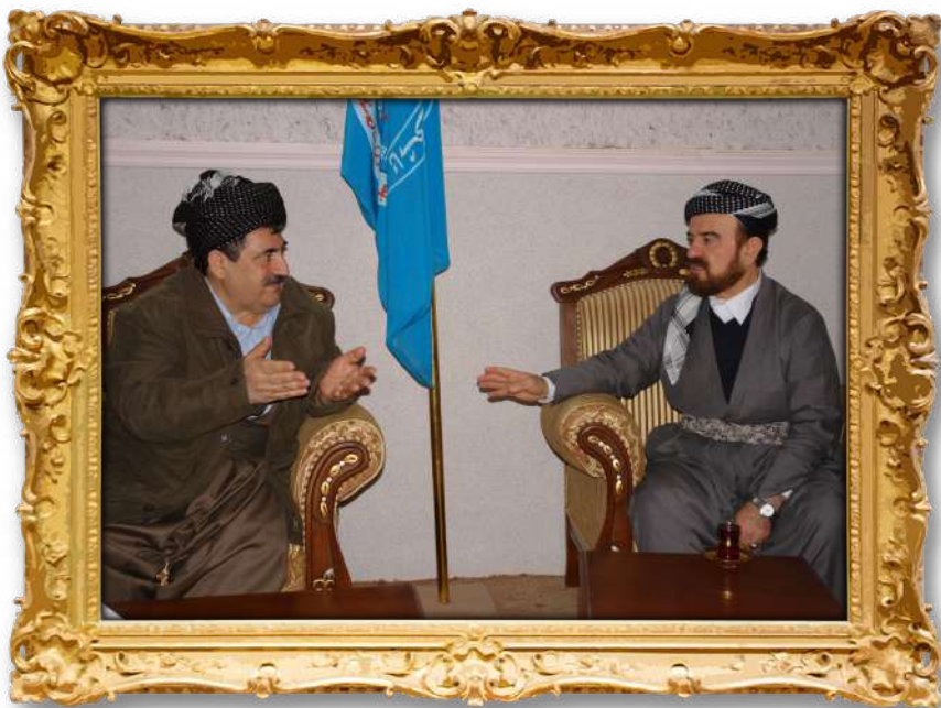
دكتور عەلى لەگەن محەمەد حاجى مەحمود؛ سكرتېرى حيزبى سۇسپاليستى كوردستان