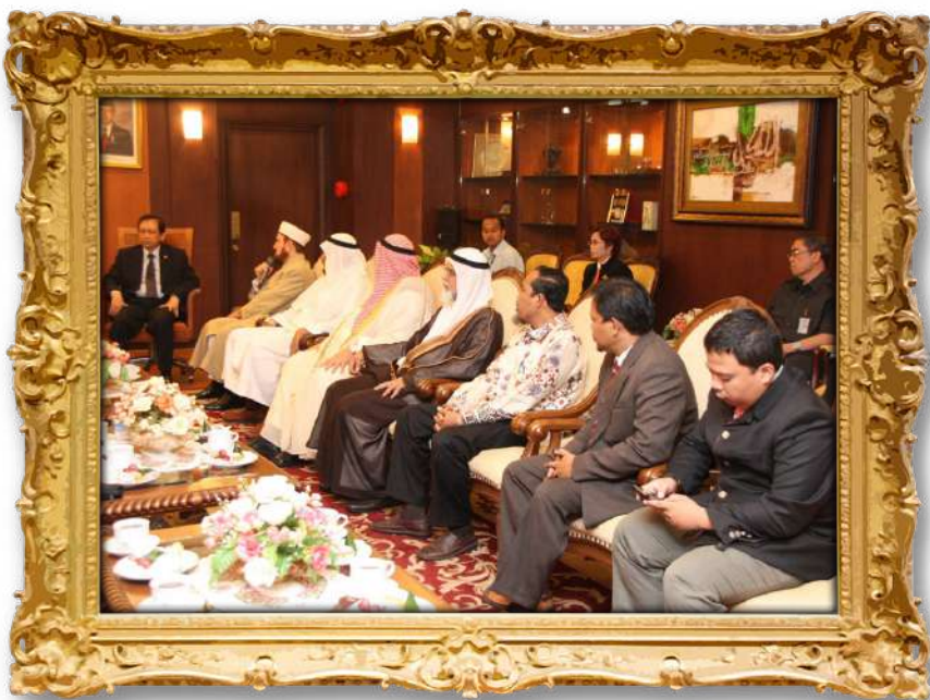
دكتور لەگەن سەرۆكى پەرلەمانى ئىندونىسىيا ۲۰۱۰ز