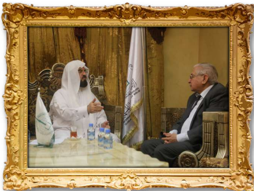
دکتۆر لەگەڵ باڵیۆزی ئازەربایجان لەوڵاتی قەتەر ۲۰۱۰ز