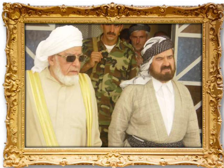
دکتۆر عەلی لەگەن شیخ عەلی عەبدولعەزیز؛ رابەری پێشووتری بزوتنەوهی ئیسلامی