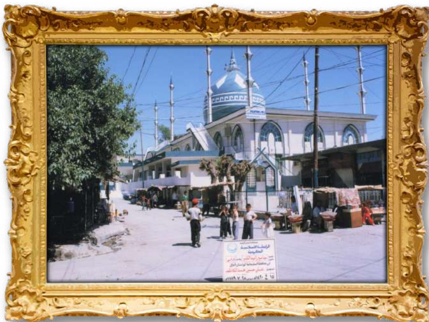
مزگہوتی گہورہی رانیہ؛ لہلایہ ن رابیتهی ئیسلامیمی کوردہوہ دروستکراوہ