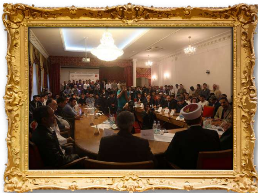
موحازه ره یه کی دکتۆر له مۆسکۆ ۲۰۱۰ ز