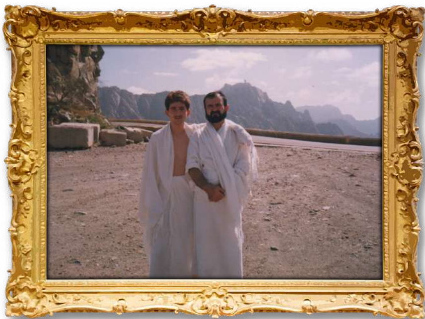
دكتور له گەن كاك ماجدى كورى لەشارى مەككەى پيرۆز