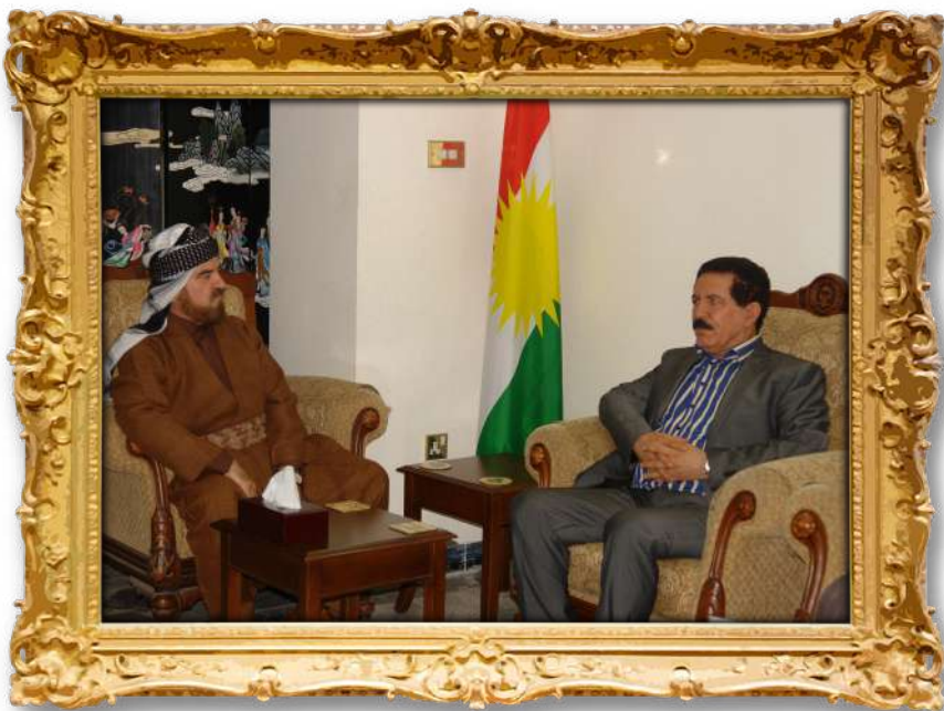
دكتور لەگەن بەرپز كۆسەرت رەسول عەلى؛ جىگىرى پېشوتى سەرۆكى ھەرىمى كوردستان