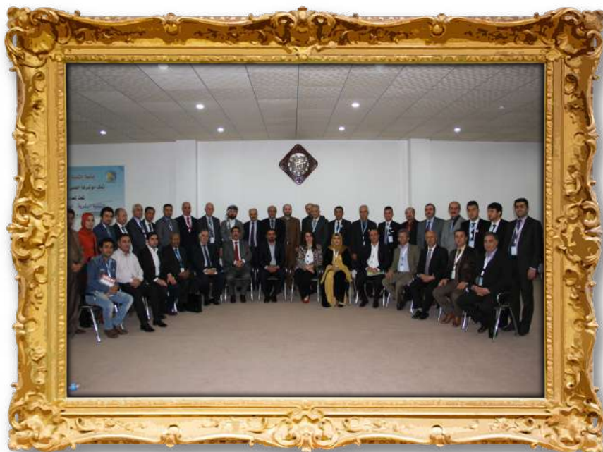
یەكەمین كۆنفرانسی نیودهولەتی زانستی زانکۆی گەشەپێدانی مەرووبی