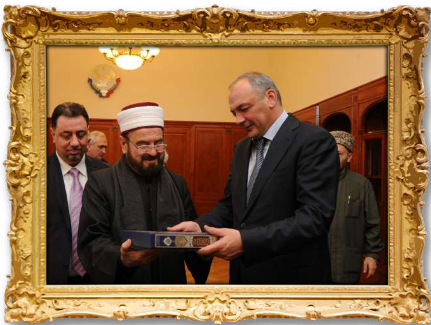
دەكتۇر لەگەن سەرۋەكى داغىستان ۲۰۱۲