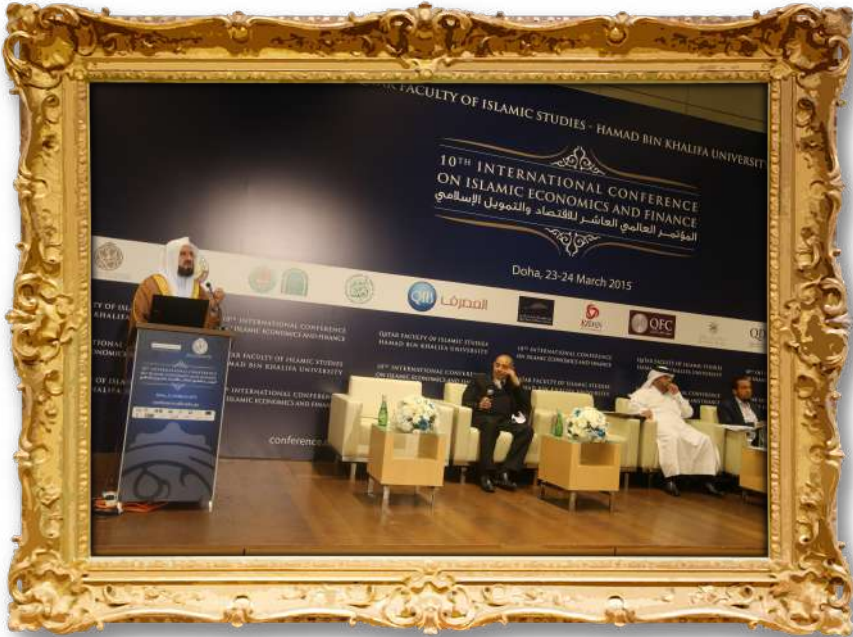
دكتور عملی لهكونگهرى ئابوورى لهولاتی قهتەر ۲۰۱۰ز