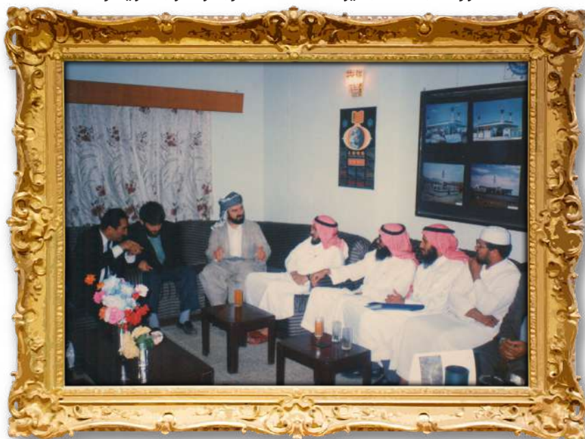
دکتۆر پێشوازی لەھەندیك میوان دەکات لەئۆفیسێی رایبتهی ئیسلامی کورد ١٩٩٣