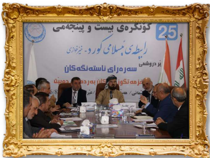
بىستو پىنچەمىن كۆنگرەى رابىتەى ئىسلامىى كورد