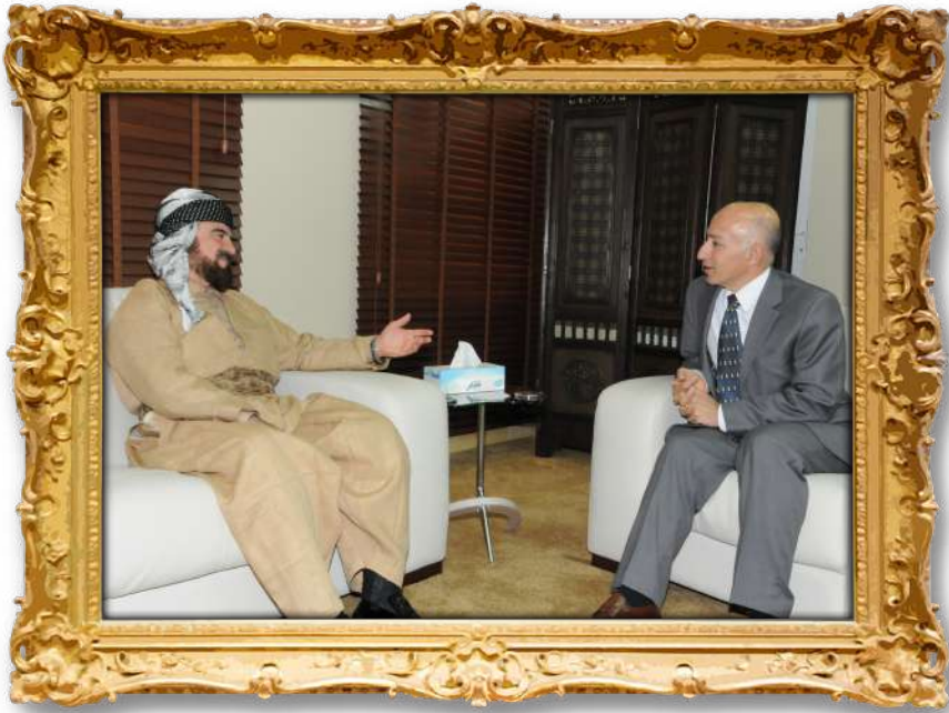
دکتۆر عەلی لەگەن دکتۆر دلاوەر عەلانیەدین؛ وەزیری پێشووتری خۆپێندنی باڵا