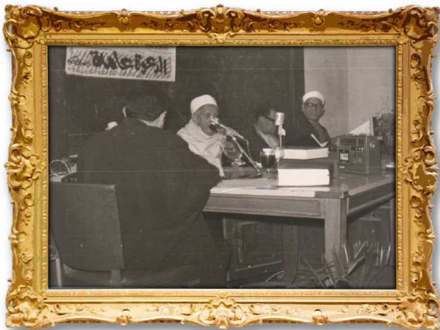
گفتوگوى دكتوراي دكتور له كۆليژى ياساو شەرىعەت لەزانكۆى ئەزھەر