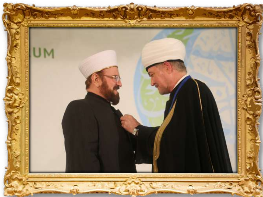
دکتۆر لەکاتی وەرگرتنی خەڵاتی ریزلینان لەلایەن کارگیڤی کاروباری ئایینی لە روسیا ۲۰۱۴ ز