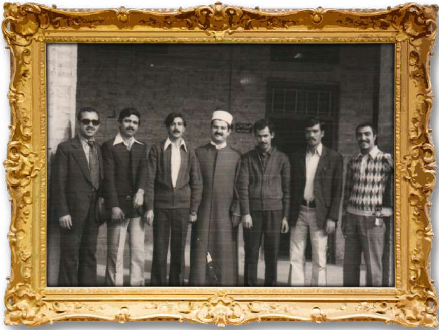
دکتۆر لەگەڵ چەند ھاوڕێیەکیدا لە کۆلیژی ئیمام ئەعزەم لە بەغداد