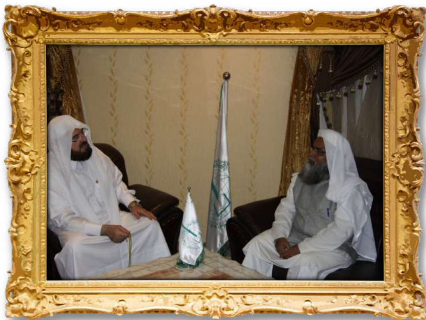
دكتور لەگەن سەرۆكى كۆمەلەى فىقھ لەھندستان ۲۰۱۴ز