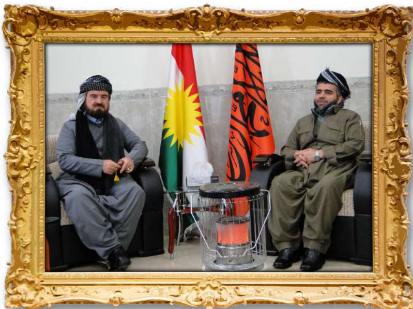
دکتۆر عهلی له گهن مامۆستا عهلی باپیر: سه رۆکی کۆمه ئی دادگه ری کوردستان