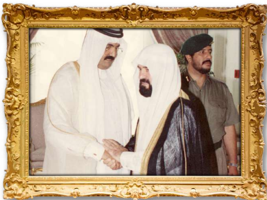
دکتۆر عەلی لەگەڵ شیخ حەمد ئالشانی؛ ئەمیری پێشوووی ولاتی قەتەر