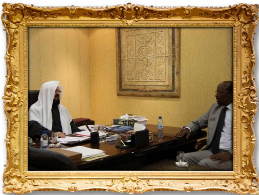
دكتور لەگەن سەفیری سوومان لەقەتەر ۲۰۱۲ز