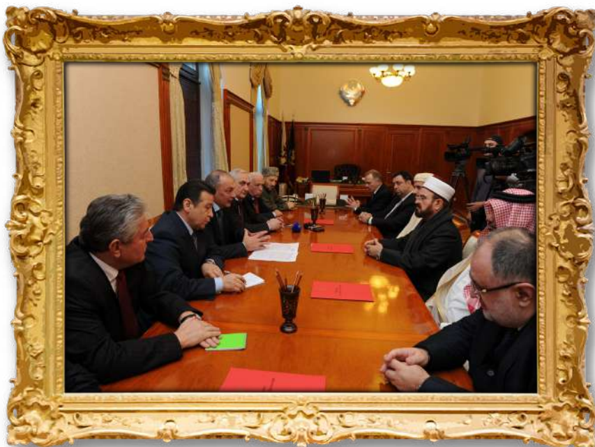
دکتۆر لەگەن سەرکردەکانی حکومەتی داغستان ۲۰۱۲ز