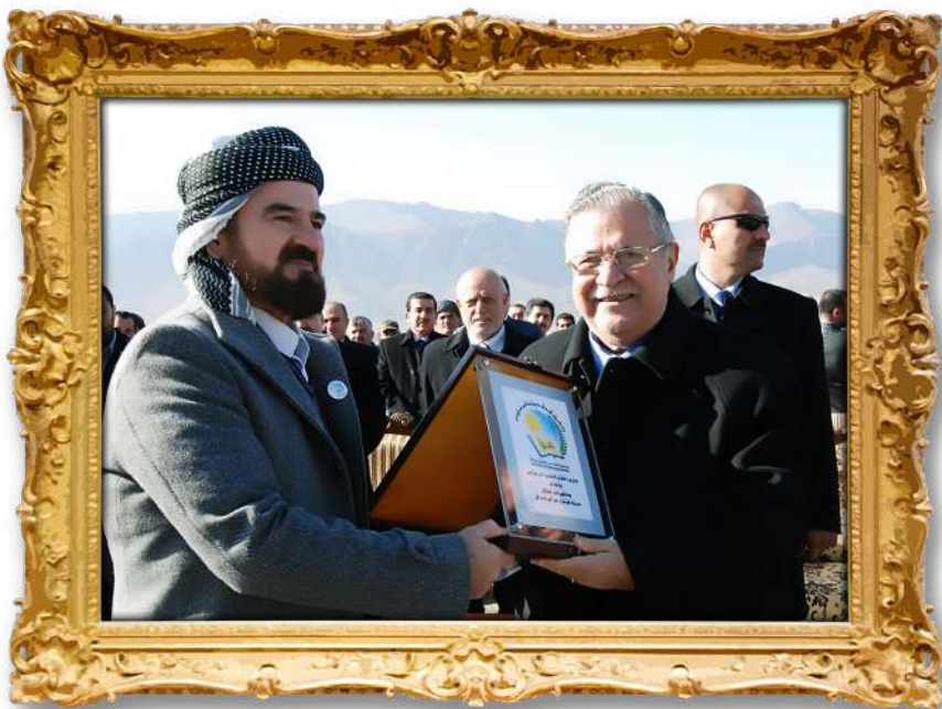
دكتور لەگەن بەرپز مام جەلال لە مەراسىمى كردنەوہى زانكۆى گەشەپيدانى مروپى لەقەرەداغ ۲۰۰۷ ز