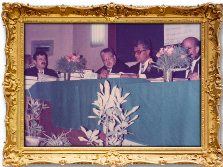
گفتوگۆی دکتۆرای دکتۆر لەکۆلیژی یاساو شەریعەت لەزانکۆی ئەزھەر