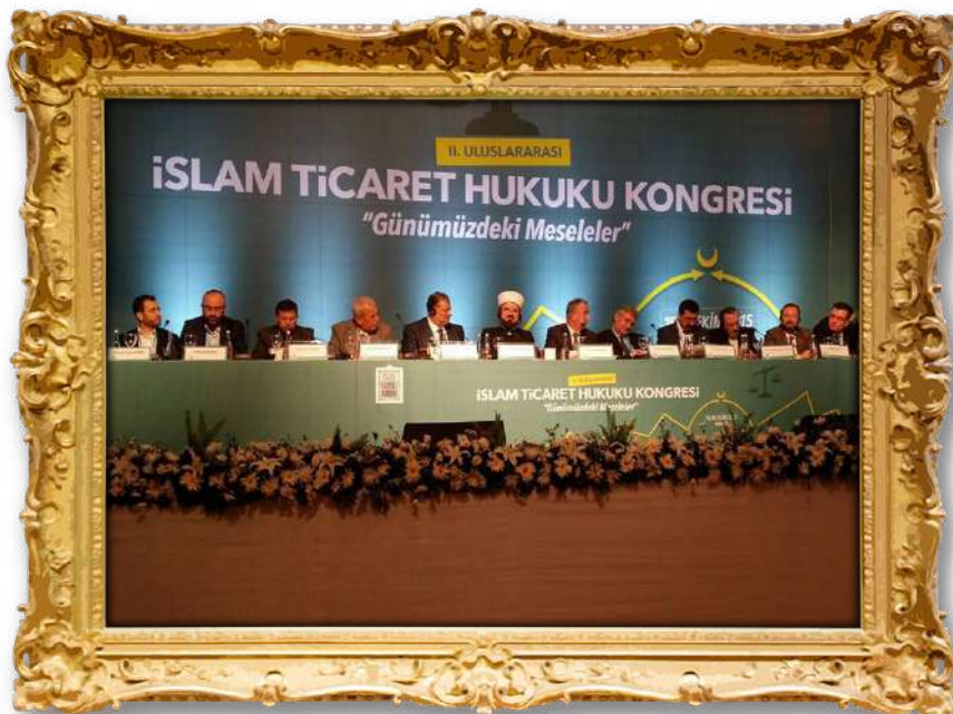
دکتۆر له کۆنگره ی قونیا ۲۰۱۰ ز