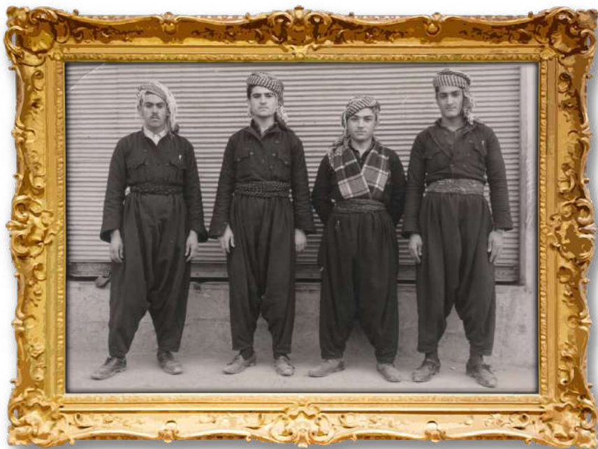
دكتور لەگەن چەند ھاورپپەكىدا لەپەيمانگاي ئىسلامى لەسلىمانى