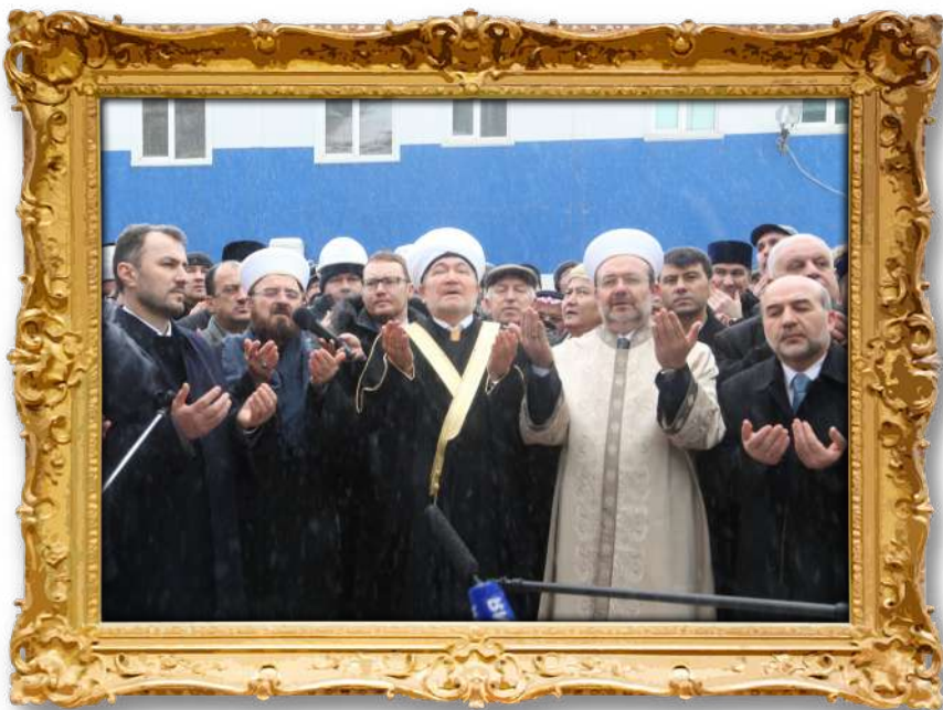
مەراسىمى كىردنەۋەى گەۋرەتەرىن مەزگەۋت لەمۇسكۆ ۲۰۱۴ ز