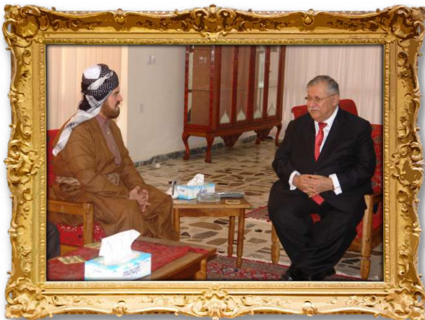
دکتۆر له‌گه‌ن فه‌خامه‌تی سه‌رۆک کۆماری پێشوو ی عێراق؛ جه‌لال تاله‌بانی