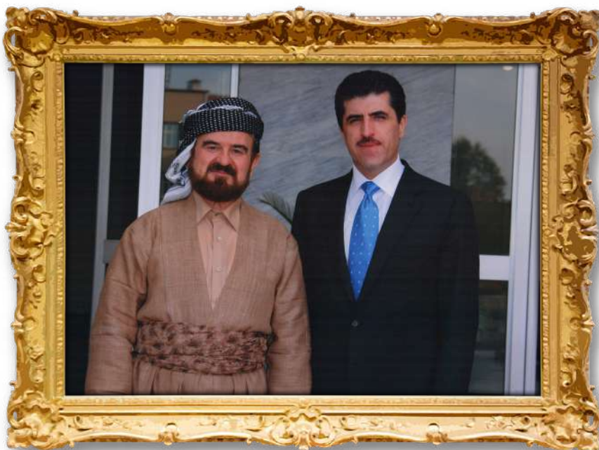
دکتۆر عەلی لەگەن بەرێژ نیچیرقان بارزان: سەرۆکی ھەرێمی کوردستان