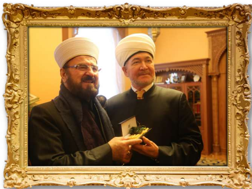
دکتۆر عەلی لەگەڵ عەینەدین راوی، موفتی وڵاتی روسیا ۲۰۱۴ ز