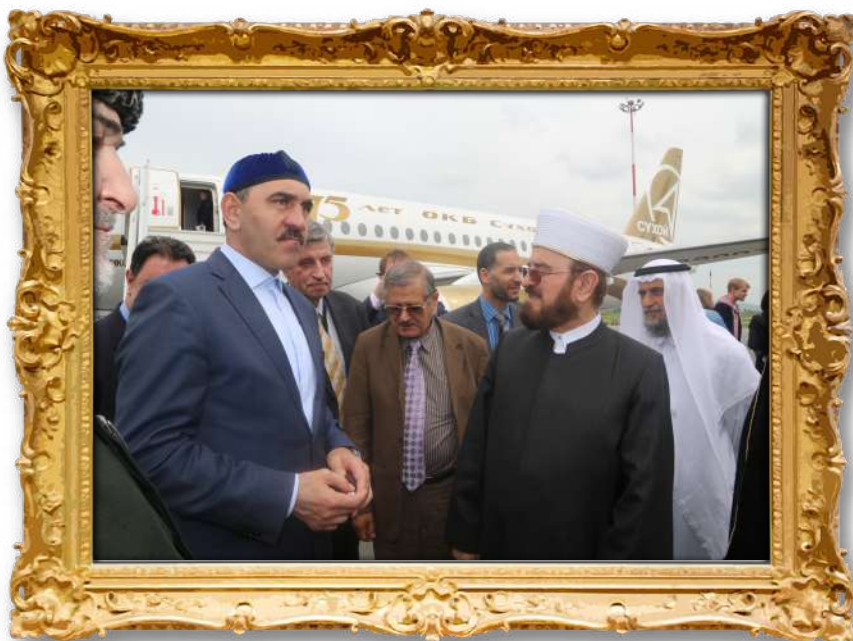
دکتۆر لەگەن سەرۆکی ئەنگۆشیا ۲۰۱۰ز