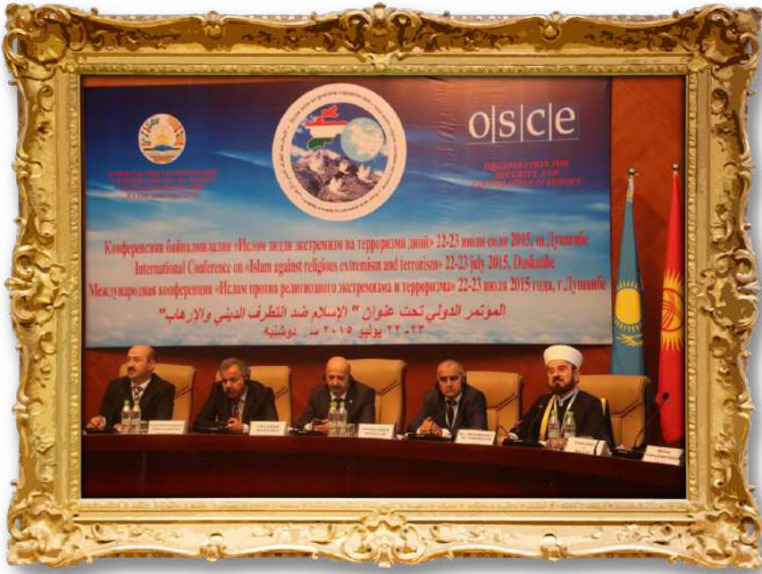
دكتور لهولاتی تاجیکستان ۲۰۱۰ز