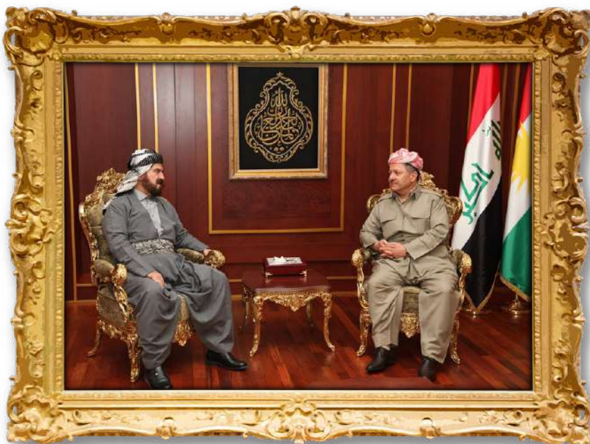
دکتۆر له‌گه‌ن به‌رێز مه‌سه‌عود بارزانی سه‌رۆکی پێشوو ی هه‌ریه‌م