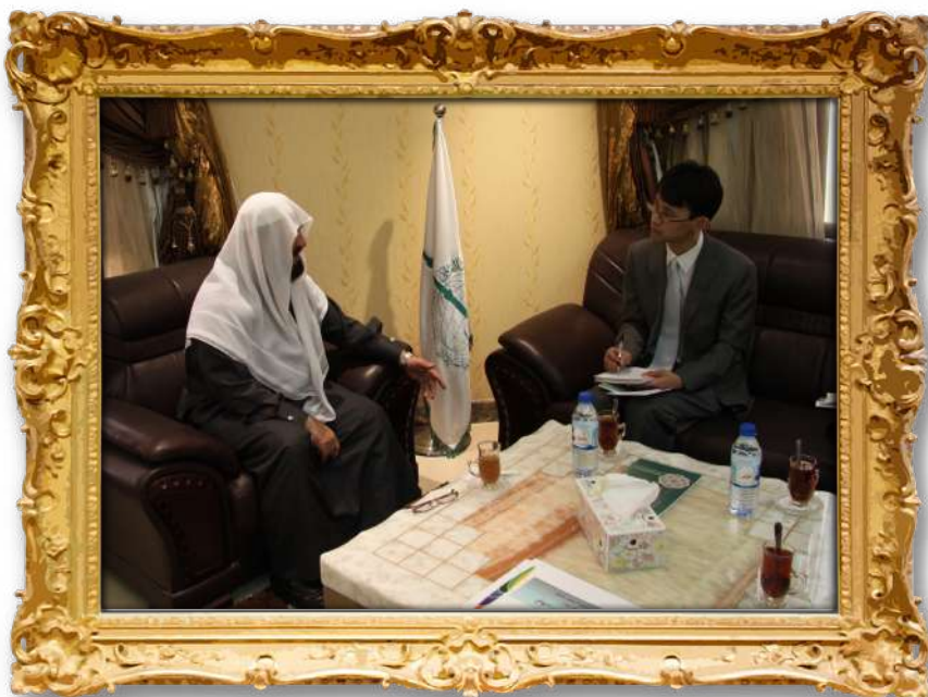
دکتۆر لەگەڵ سکرێتێری سیاسیی لەباڵیۆزخانەی یابان لەقەتەر ۲۰۱۲ز